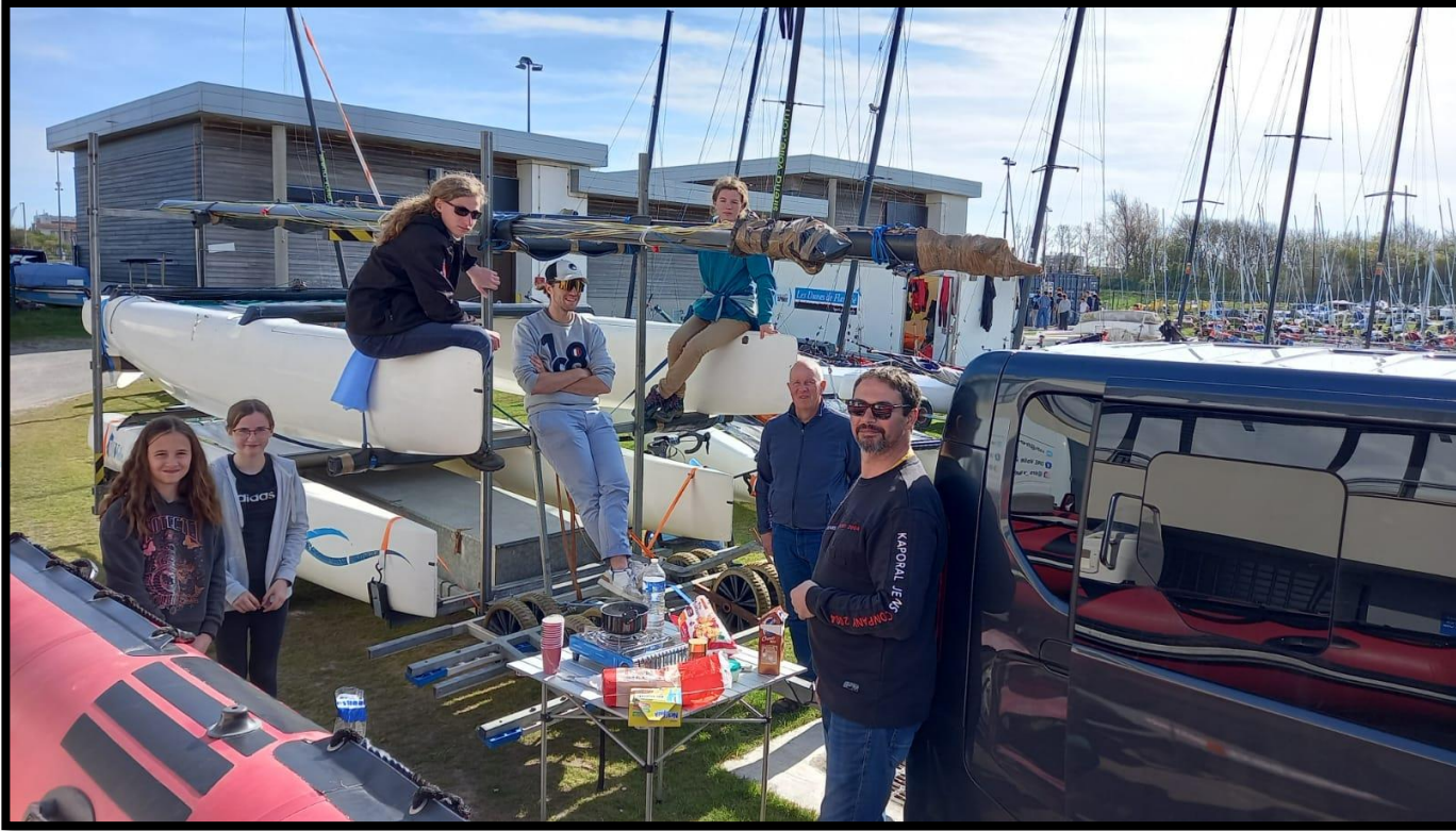
Une belle équipe à Dunkerque pour deux régates de championnat de ligue multicoque.

Ce week-end, le plan d'eau de la Frette n'a pas accueilli nos voiliers mais des pêcheurs. Une compétition de pêche avait lieu du 13 au 16 avril empêchant ainsi la navigation sur le plan d'eau.