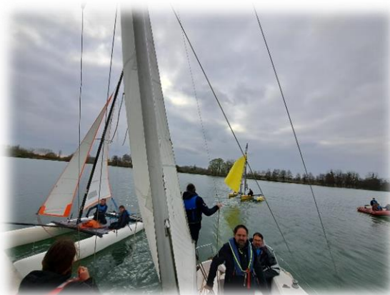
A bord de l'Edel

Un peu de vent en ce samedi 8 avril. Nous avons profité d'un planning moins rempli pour remettre à l'eau notre Edel 600 ! L'Edel, notre petit habitable de 6 mètres et de presque 1 tonne. Pour rappel, ce bateau a été donné au club il y a quelques années par un Ternois que nous remercions encore aujourd'hui. Une navigation en équipe et synchrone sont nécessaires pour avoir les meilleures sensations possibles. Peut-être les prémices de futures navigations en mer, avec un J80 par exemple, qui sait.