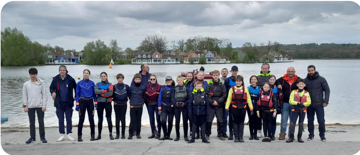
Encore un stage organisé par le CDVA réussi

Le prochain stage aura lieu pendant les vacances de la Toussaint. Tout le monde y est le bienvenu.