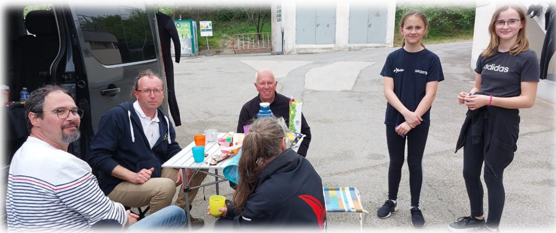
Le casse-croûte habituel avant de rentrer à la maison

A Tergnier, le club était ouvert et les adhérents présents en ont profité pour refaire une petite beauté au Mini-J, bateau handisport, mais aussi bien pour les valides. A venir essayer !